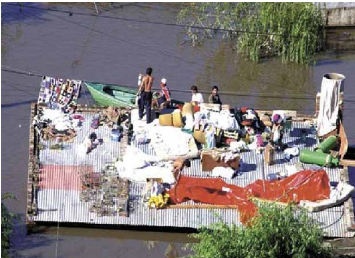
Figura 9 Damnificados producto de desastres.

Finalmente el tercer escenario que debe considerarse es la respuesta ante aquellos damnificados que desatendiendo abiertamente las advertencias de equipos técnicos institucionales, invadieron espacios con altos niveles de amenaza y construyeron en ellos viviendas. En estos casos el Estado y sus instituciones deben replantearse su papel y considerar si tiene sentido que, en respuesta a la no obediencia de las normas y disposiciones por parte de estos habitantes, es correcto premiarlos con una vivienda una vez que ocurre lo que, además de inevitable, había sido advertido. Desde luego que el costo político de una postura menos complaciente ante estos ciudadanos deberá valorarse y en todo caso afrontarse, sin embargo es difícil pensar en mecanismos distintos que permitan evitar que estas conductas sociales se sigan repitiendo (figura 6).