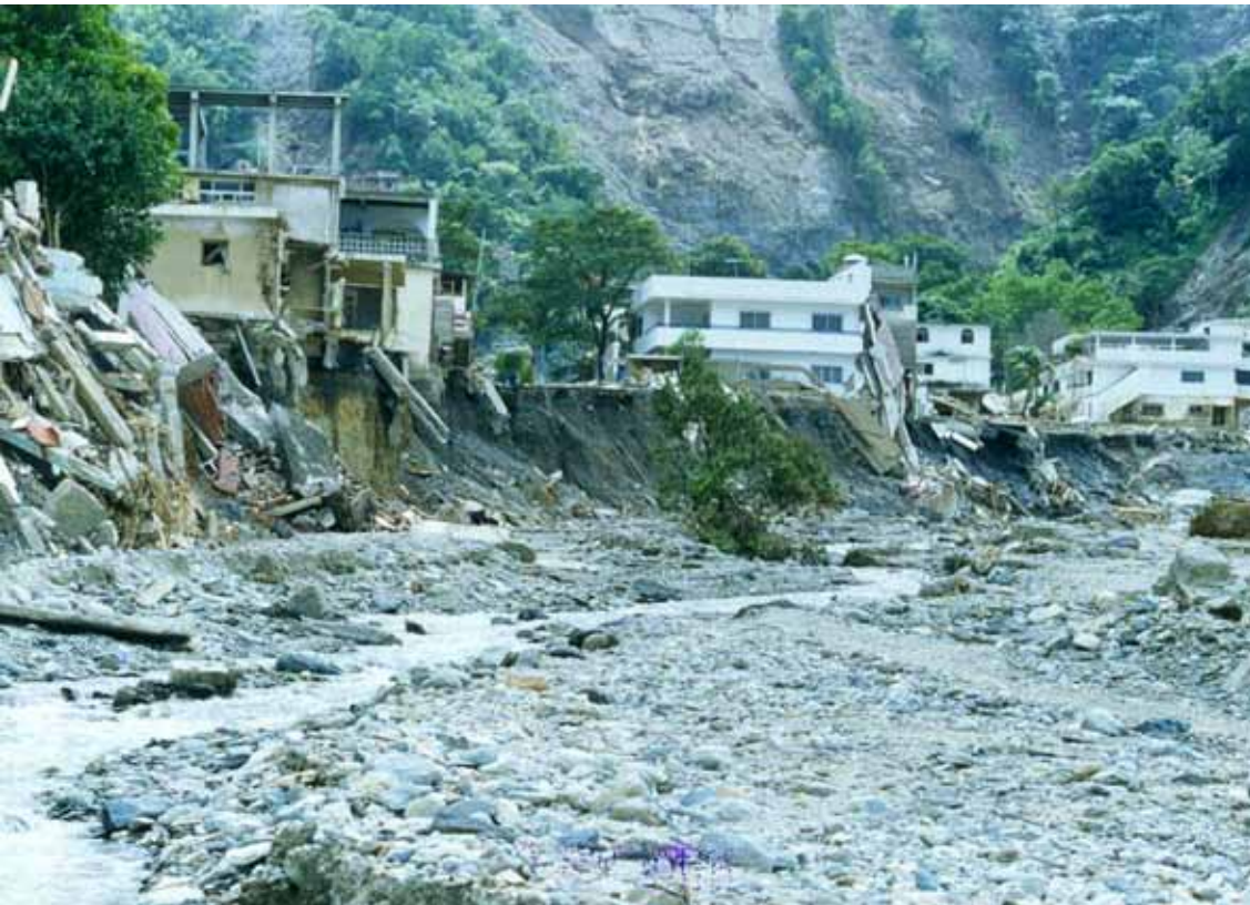
Figura 8 Daños asociados a eventos de hidrogeológicos registrados en la costa norte de Venezuela en diciembre de 1999.

que de manera premeditada y conciente ocupa espacios de altísimo nivel de riesgo, desatendiendo recomendaciones institucionales, a la espera de que durante la próxima temporada de lluvias se logre materializar su condición de damnificado, etc.