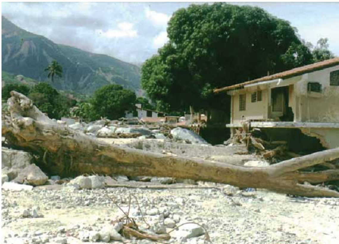
Figura 7 Daños asociados a eventos de hidrogeológicos registrados en la costa norte de Venezuela en diciembre de 1999.

tual ocurrencia de épocas de “vacas flacas”, sino debido a potenciales repercusiones sociales que pudieran gestarse en un país donde el volumen de población que vive en condiciones inaceptables de riesgo de desastre es muy alto y donde los esfuerzos que se hacen a fin de mitigar esos riesgos aún son insignificantes.