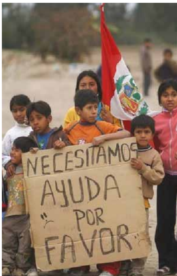
Figura 10 Niños pidiendo ayuda tras ser afectados por terremoto en agosto del 2008.