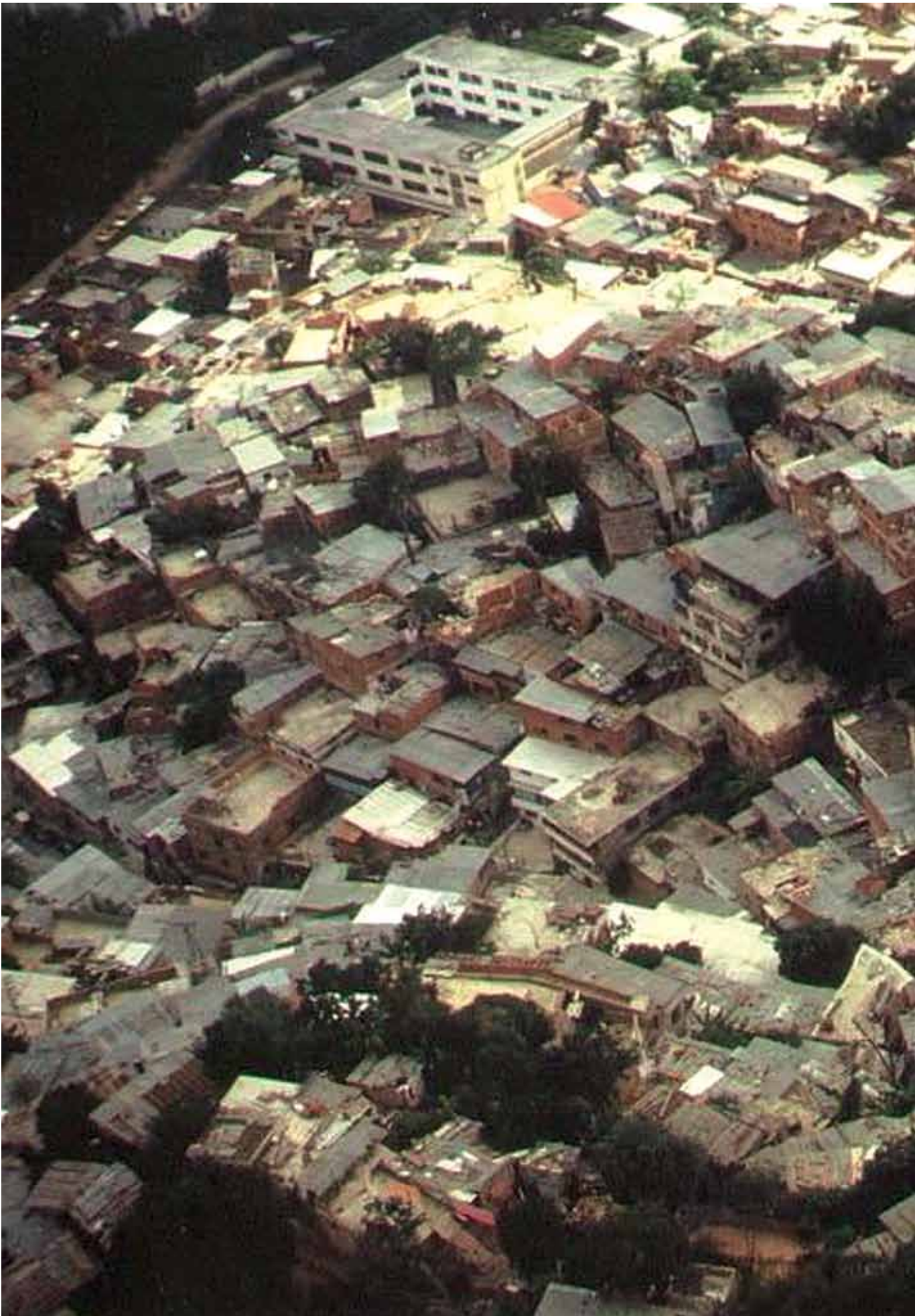
Figura 5 Ejemplo de nivel de riesgo urbano construido en nuestras ciudades.