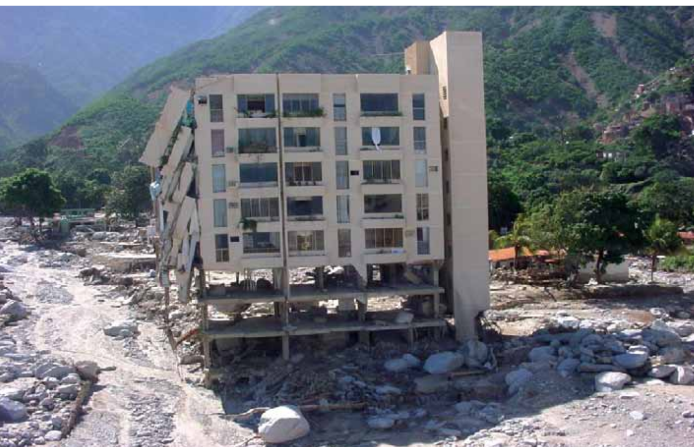
Figura 2 Edificio xxxxx ubicado en xxxxxxx. ¿Cambio climático o modelo de desarrollo?.

mento en la frecuencia o severidad de lo que podríamos denominar “eventos disparadores”, lo que para el caso de los desastres de origen natural implicaría aceptar que hoy existen más o peores terremotos, volcanes o huracanes que antes. Sin embargo es muy importante destacar que no existe ninguna evidencia que sugiera que el crecimiento del impacto de los desastres en el mundo se deba a fenómenos cada vez más fuertes ni más frecuentes.