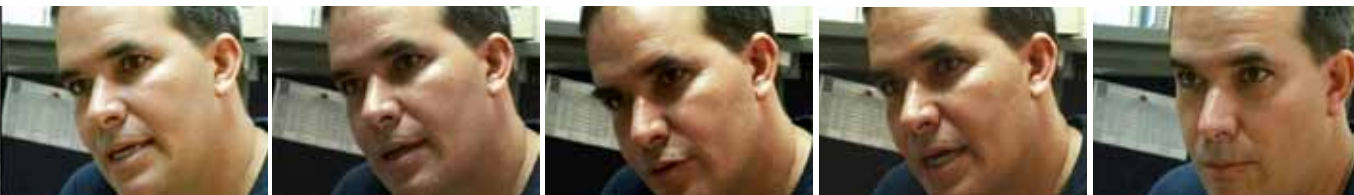
Secuencia: Alejandro Linayo