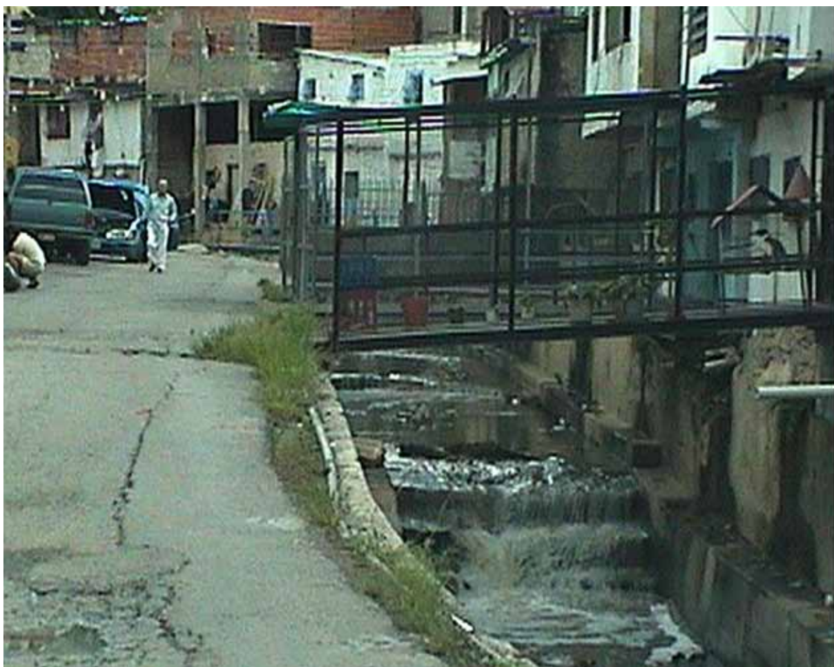
Figura 6 Ejemplo de nivel de riesgo urbano construido en nuestras ciudades.