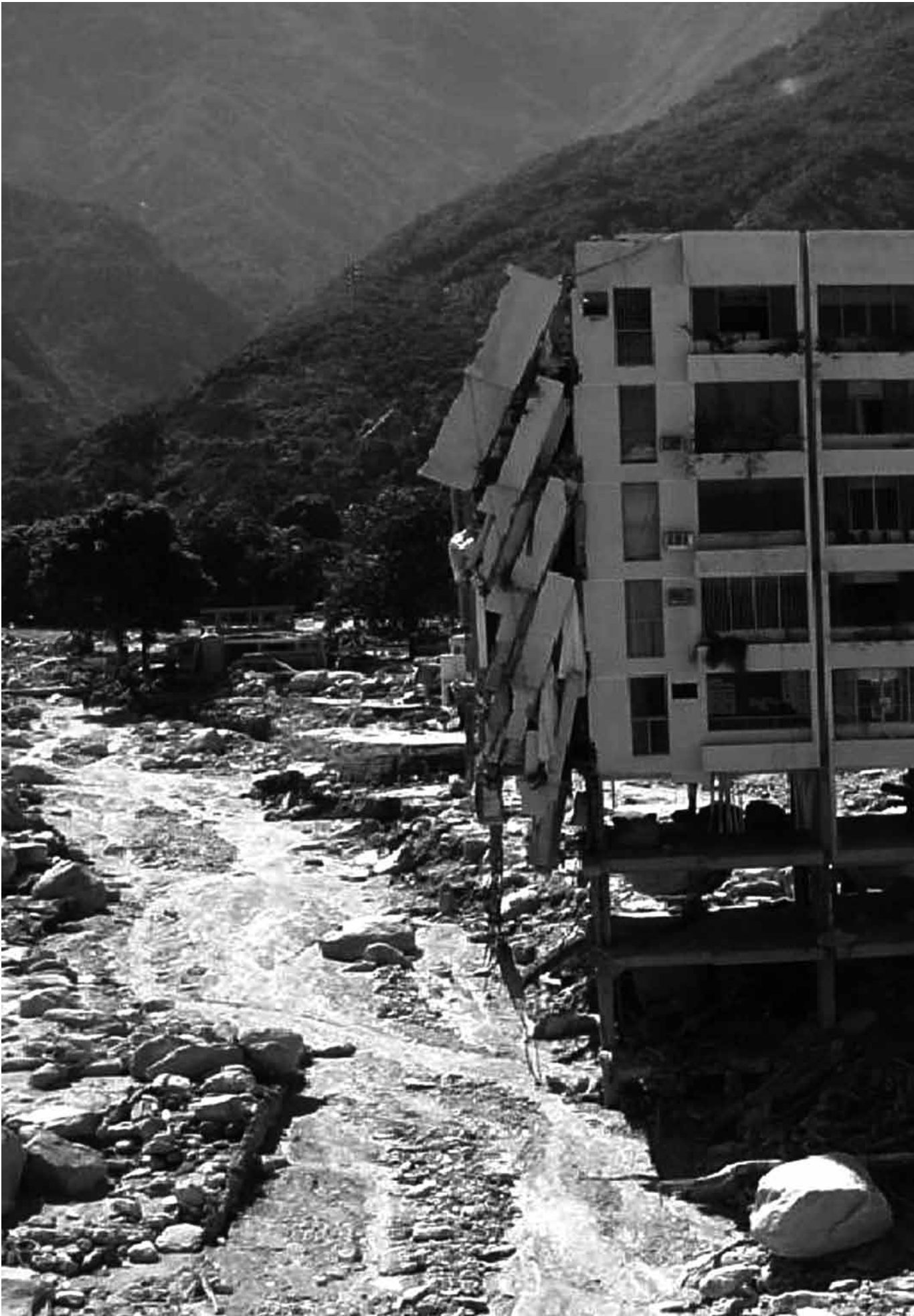
Figura 0 Edificio xxxxx ubicado en xxxxxxx. ¿Cambio climático o modelo de desarrollo?.