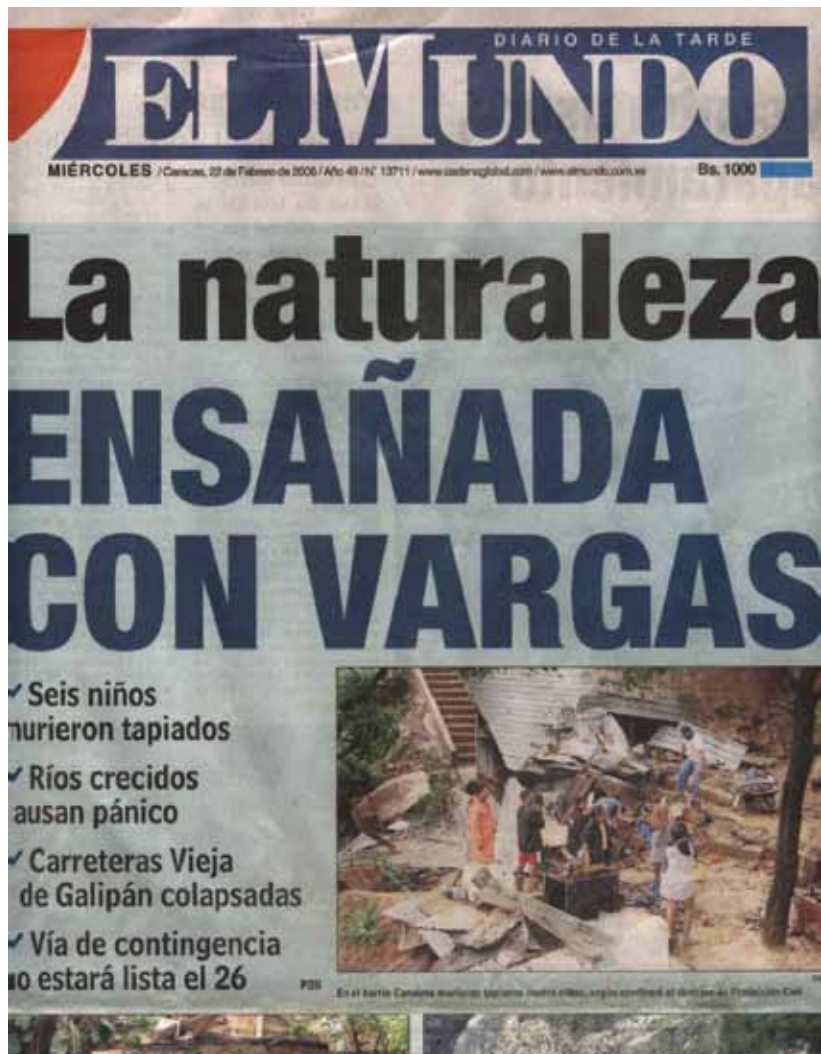
FIGURA 4 Portada diario Venezolano EL MUNDO del 22-2-2006. El discurso mediático demuestra con frecuencia la vigencia que aún tiene el enfoque providencialista.