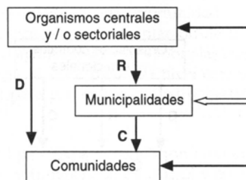
a. Esquema prevaleciente gestándose en la actualidad