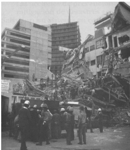
San Salvador, terremoto del 10 de octubre de 1986