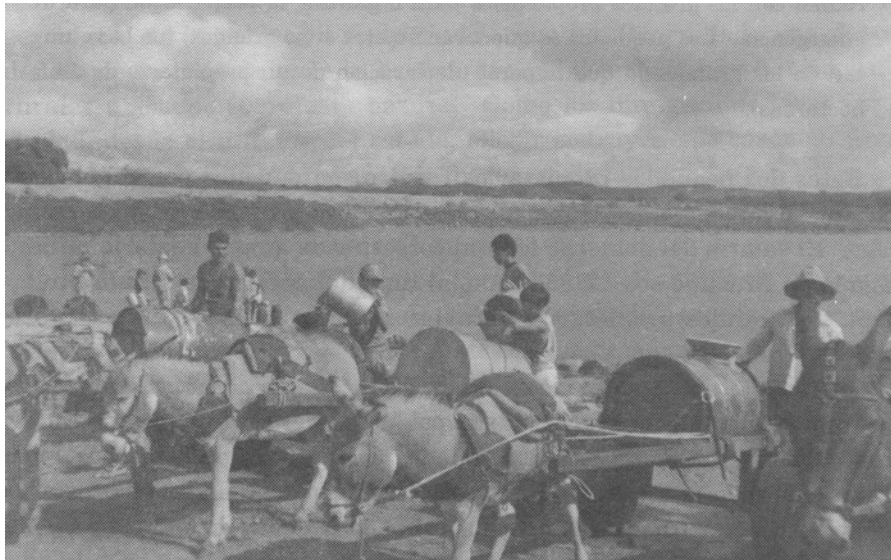
Foto 2: Los pobladores de la zona rural, durante los periodos de sequía prolongadas, migran a la zona urbana y son utilizados en sub-empleos que no requieren una mano de obra calificada.

La degradación ambiental amplía los impactos socio-económicos de la sequía y aumenta aún más la vulnerabilidad de los individuos y la población de hambrientos, de mendigos, de subempleados (foto 2), de personas desnutridas o desempleadas, de las "boinas frías", etc., por tanto, crecen rápidamente los centros urbanos independientemente de su capacidad de crecimiento.