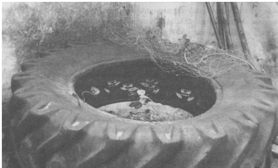
Foto 3: Crianza de cangrejos dentro de neumáticos sacados de los basureros.

Las comunidades costeras, tales como aquellas asociadas con el estuario de Mamanguape, que es dependiente de esos cangrejos como alimento y como recurso económico, están amenazadas por la intensa captura de los cangrejos, para así abastecer las necesidades de la ciudad. Además, los que atrapan cangrejos en los bosques de mangle, protegidos por la Agencia Federal del Medio Ambiente, no utilizan los métodos tradicionales de captura. Una forma de red es hecha de una malla de plástico, de los sacos de semillas del mismo material, los que son colocados sobre las cuevas de la presa, allí la deja por un día o más y luego retorna para recoger el animal capturado. Este hecho no implica sólo la captura excesiva de cangrejos, sino pérdidas de proteínas debido a la muerte de otros animales que son arrollados en las mallas de nylon. Una respuesta interesante de los tradicionales capturadores de cangrejos a los no tradicionales, es que estos utilizan materiales del basurero para criarlos en cautiverio (foto 3).